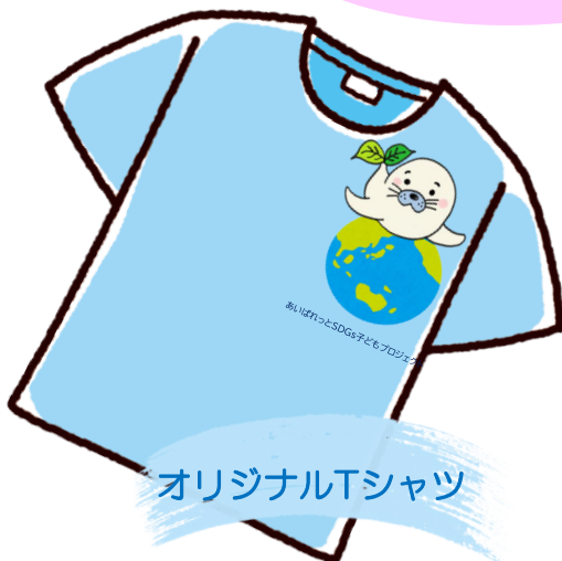
オリジナルTシャツ