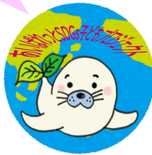
オリジナル缶バッジ