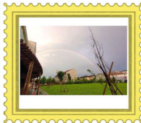
7/11 きれいな虹 @あいぱれっと

●共催／ほっぺっぺおもちゃ図書館 ●協力／浦和トライブラリーおもちゃ箱ぐーちょきぱーていー