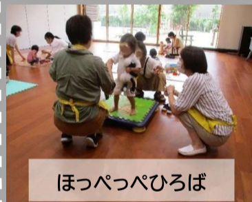
ほっぺっぴひろば