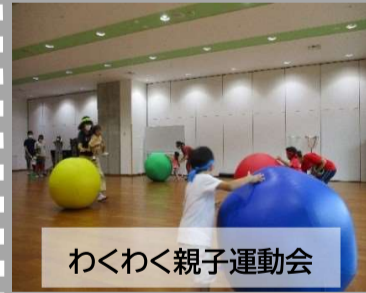
わくわく親子運動会