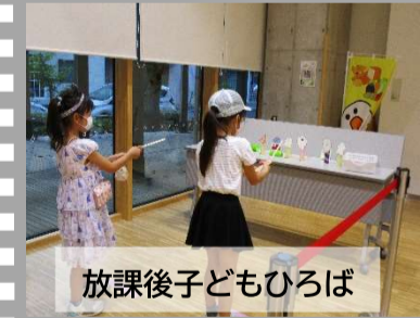
放課後子どもひろば