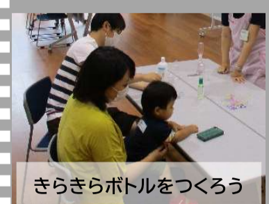
きらきらボトルをつくろう

※日程・時間などは変更になる可能性がありますので、あらかじめご承知おきください。詳細は、HP、各チラシでご確認ください。